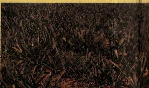
ABACAXI - MILHO - FEIJÃO