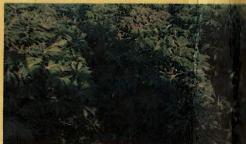
MANDIOCA - FEIJÃO - AMENDOIM