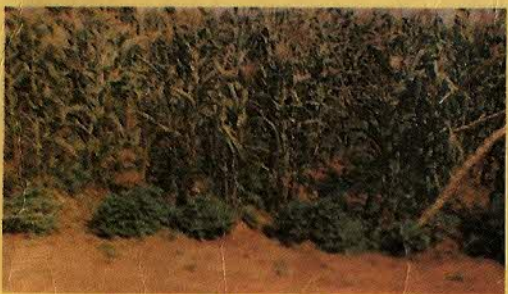
MILHO - FEIJÃO - INHAME - BATATA