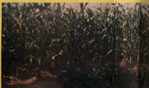
MILHO - FEIJÃO - MANDIOCA