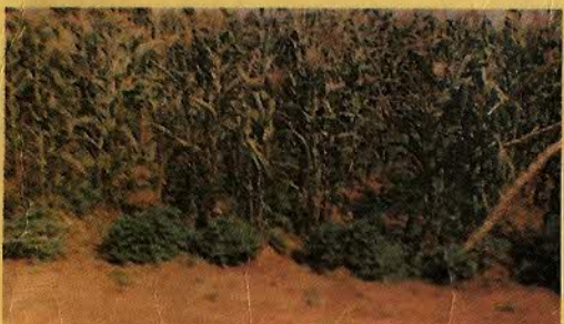
MILHO - FEIJÃO - INHAME - BATATA