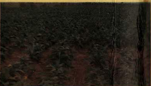
FUMO - FEIJÃO - ALGODÃO