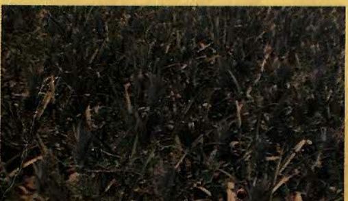
ABACAXI - MILHO - FEIJÃO