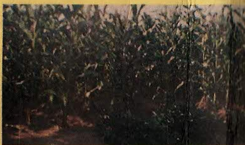
MILHO - FEIJÃO - MANDIOCA