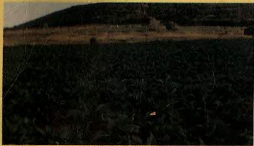
FUMO - FEIJÃO - ALGODÃO - BATATA