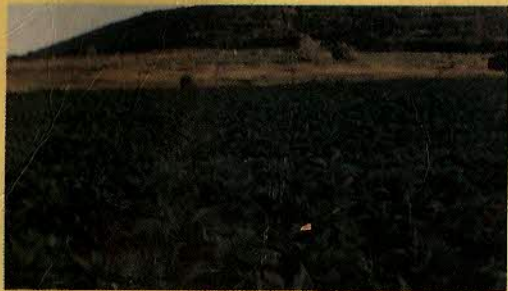
FUMO - FEIJÃO - ALGODÃO - BATATA