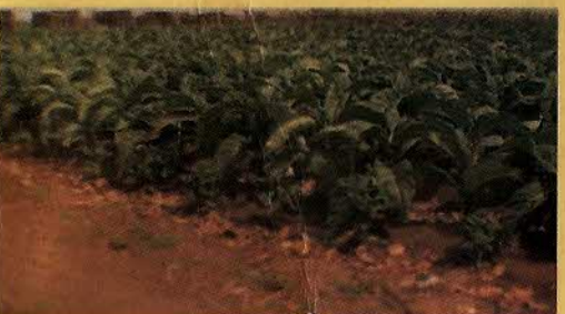
FUMO - FEIJÃO - ALGODÃO