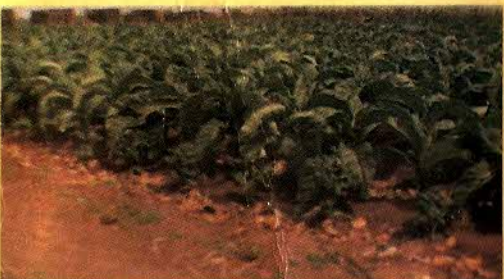
FUMO - FEIJÃO - ALGODÃO