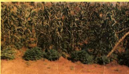
MILHO - FEIJÃO - INHAME - BATATA