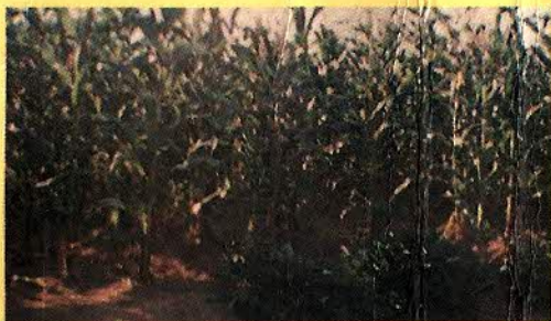
MILHO - FEIJÃO - MANDIOCA