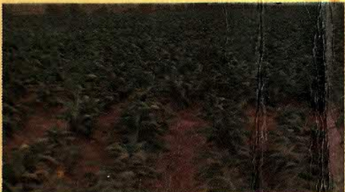
FUMO - FEIJÃO - ALGODÃO