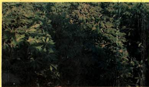
MANDIOCA - FEIJÃO - AMENDOIM