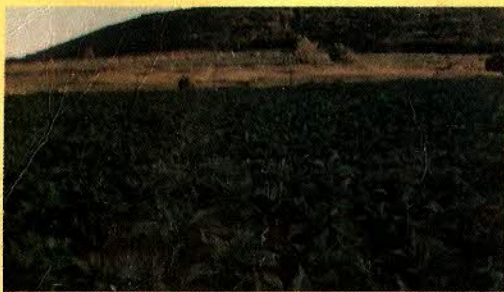
FUMO - FEIJÃO - ALGODÃO - BATATA