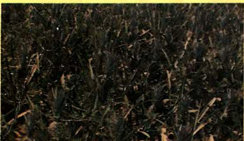
ABACAXI - MILHO - FEIJÃO